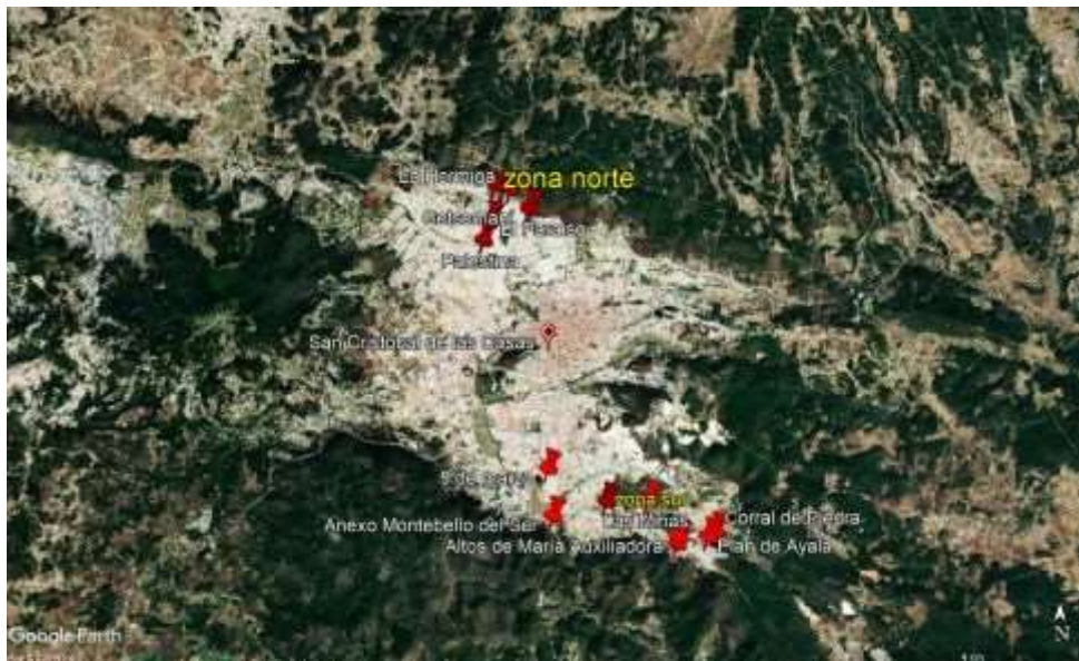
Figura 1 Vista satelital de las unidades de estudio, periferias norte y sur de San Cristóbal de las Casas

Los asentamientos localizados en la periferia norte objeto de estudio fueron La Hormiga, Getsemaní, Paraíso y Palestina. En el caso de la zona sur, la investigación abordó las siguientes colonias: Corral de Piedra, Plan de Ayala, Altos de María Auxiliadora, Anexo Altos de María Auxiliadora, Las Minas, Anexo Montebello del Sur y 5 de Marzo (véase figura 1).