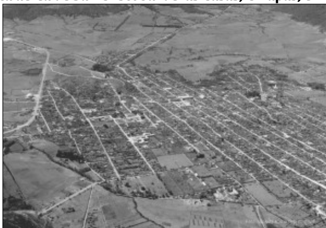
Fotografía 1 Vista aérea de San Cristóbal de las Casas, Chiapas, en 1968